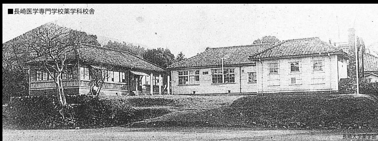
■長崎医学専門学校薬学科校舎